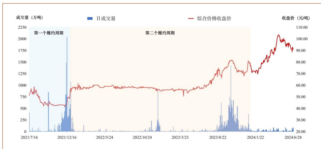
图四 全国碳排放权交易市场交易运行情况

全国碳排放权交易市场第二个履约周期每个交易日均有成交，重点排放单位交易积极性明显增强。相较于第一个履约周期，2022-2023 年新增交易开户 338 家，参与交易的重点排放单位数量上涨 31.79%，多次参与交易的重点排放单位数量上涨 32.14%，交易量超百万吨的重点排放单位数量上涨 77.59%，同时使用挂牌协议和大宗协议两种交易模式的重点排放单位数量上涨 36.87%。重点排放单位结合自身情况及早制定交易计划，交易量峰值月份由 12 月提前至 10 月，交易活跃天数明显增加 ① 。第二个履约周期结束后，2024 年上半年月均成交量、月均参与交易重点排放单位数量较 2022 年同期分别上涨 49.54%、90.79%。