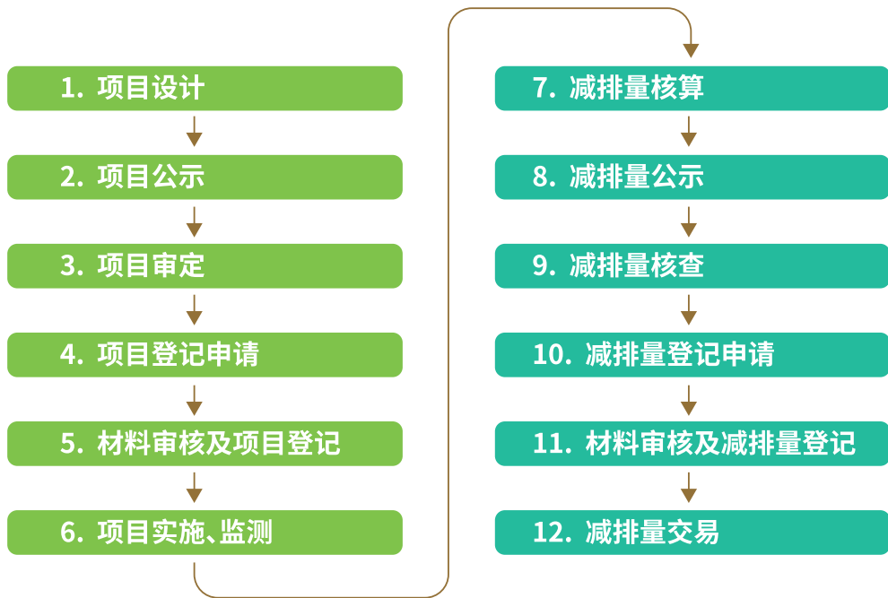
图五 温室气体自愿减排项目设计与实施流程