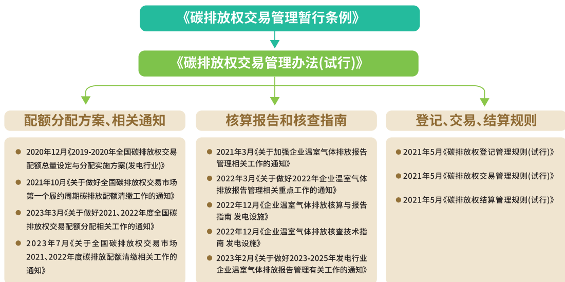
图二 全国碳排放权交易市场政策法规架构